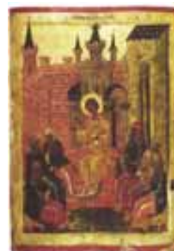
Jesus entre os doutores, Rússia, século XVI. Museu de Pskov.

Sem se deter nas tradicionais leituras estética e teológica, Jean-Yves Leloup busca, em O Ícone - Uma escola do olhar (160 páginas, R$ 94), o entendimento antropológico que desperte uma revelação ou um desvelar do homem em sua profundidade. Para isso, percorre ícones da tradição cristã russa, pintados entre os séculos XIV e XIX, com acréscimos de obras mais conhecidas e referências à arte ocidental. ◆